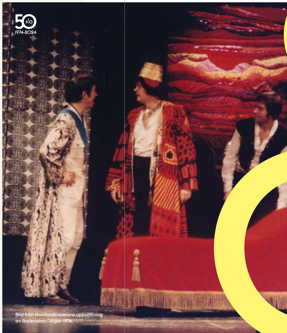
Bild från Norrlandsoperans uppsättning av Italienskan i Alger 1974.